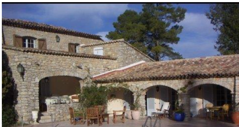
Bastida provençal (L'Helion)