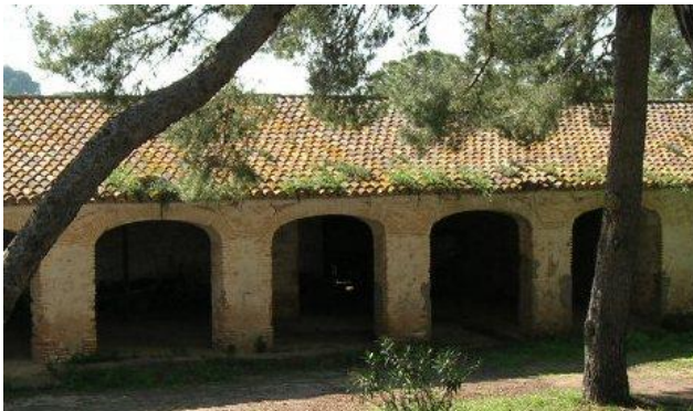
Riurau (edificació rural) semblant a la bastida provençal.

Si d'alguna cosa es pot acusar al pronom 'mosatros' és de ser d'aparició recent, no té pedigrí clàssic, és una creació popular, un vulgarisme diuen alguns coents, perquè les coses que crea el poble, des de les altures de certs intel.lectuals, es miren de reüll. El pronom 'mosatros' és nou, certament, sí, com hem vist, d'aparició escrita l'any 1769: es tracta d'una innovació en la llengua valenciana actual, que és innovadora, sí, i no arcaizant, com l'han qualificada alguns investigadors mal informats o mal intencionats. Apareix el segle XVIII, però és que eixe mateix segle és produïx també la vinguda de famílies benestants provençals i gascones a les comarques centrals, i s'aveïnen sobretot a Dénia, Gandia i València ciutat. I es dediquen a comerciar amb productes agrícoles, ametles, raïm, pansa, etc; són els Morand, Merle, Fourrat, etc; l'aparició dels riurauts es produïx també el segle XVIII, així com, lògicament, el mot riurau, que, en ser una paraula nouvinguda, en la comarca de la Marina s'interpreta de formes diferents: 'risau', 'rirau; com passa per les comarques del nord a on el mot 'peiró', de clara procedència occitana també, s'interpreta segons arriba a l'oïda: piuró, prigó, etc. I del XVIII és també la generalització de les formes verbals en 'ix', patix, florix, que reemplacen,