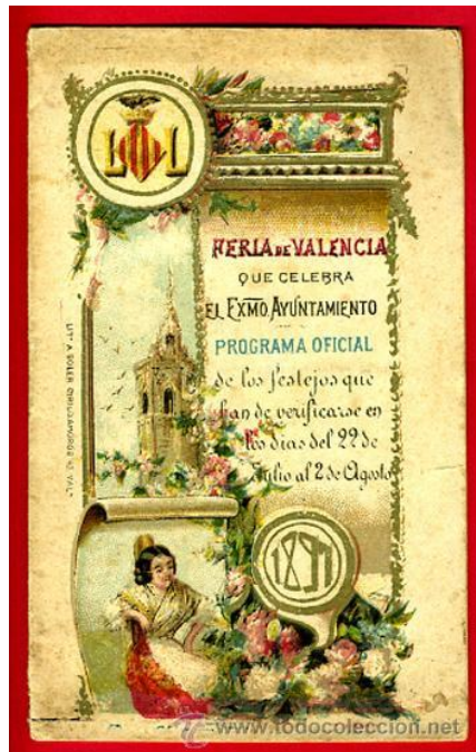
Programa de l'any 1891.

Ací aporte només uns pocs casos i uns mínims detalls. Per a una informació més ampla, els recomane el llibre, número 2 d'esta mateixa col.lecció València, Terra d'Òc , de Joan Martinis. I, en general, la revista anual Paraula d'Oc .