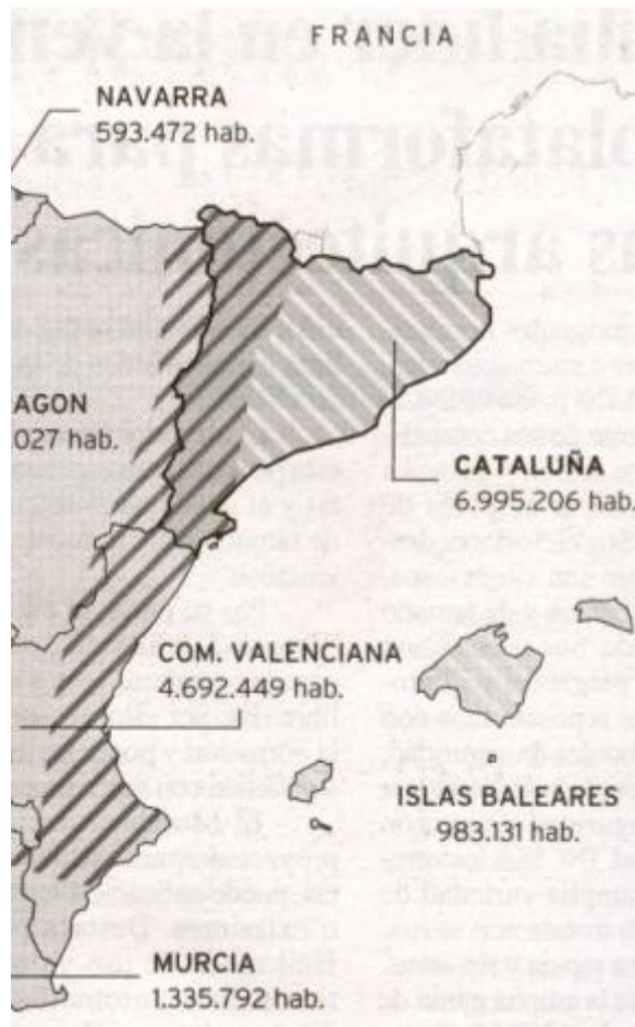
Mapa que acompanya l'article de Cécilie Chambrud

De França va arribar, l'any 2006, un article publicat a Le Monde per Cécilie Chambrud on es diu que la llengua valenciana es parla a Lleida, la Franja d'Aragó, etc. que es va convertir en viral en les xarxes socials 4 . I l'autora té la seua raó, donat que la visió de les